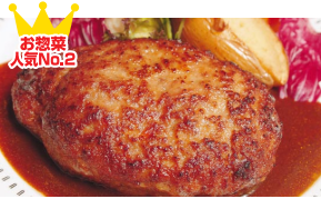
松牛 リカロバーグ (1個 180円、1kg入り 1800円 箱入り)