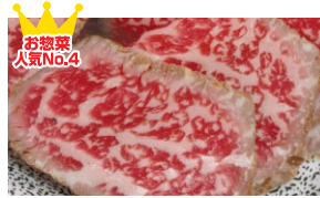
和牛タタキ (1パック 420円)