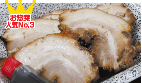
自家製焼豚 (もも1パック 380円) 自家製焼豚 (バラ1パック 380円) 自家製焼豚 (切り落とし1パック 298円)