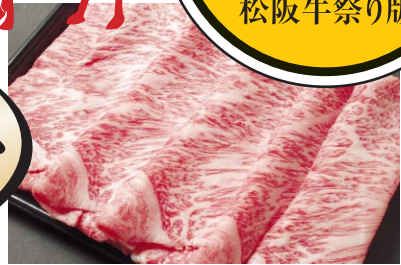
すき焼き・しゃぶしゃぶ用 (1500円・880円)