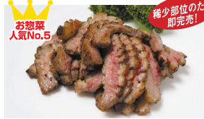
和牛カッパタタキ (1パック 420円) ※売り切れの場合はご容赦ください。